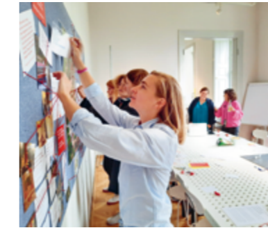
Design Campus im Wasserpalais