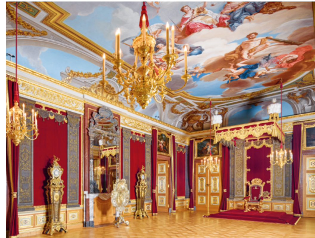
Audienzszimmer im Residenzschloss