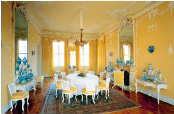
Gelbes Teezimmer im Wasserpalais