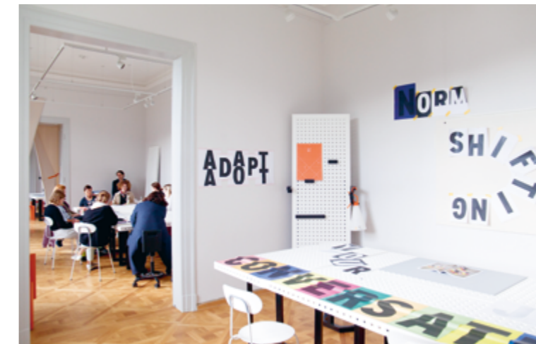
Design Campus, Sommerschule „Design & Democracy“, 2021