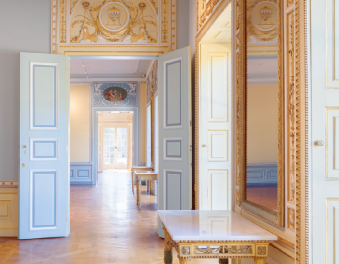
Kaiserzimmer im Bergpalais