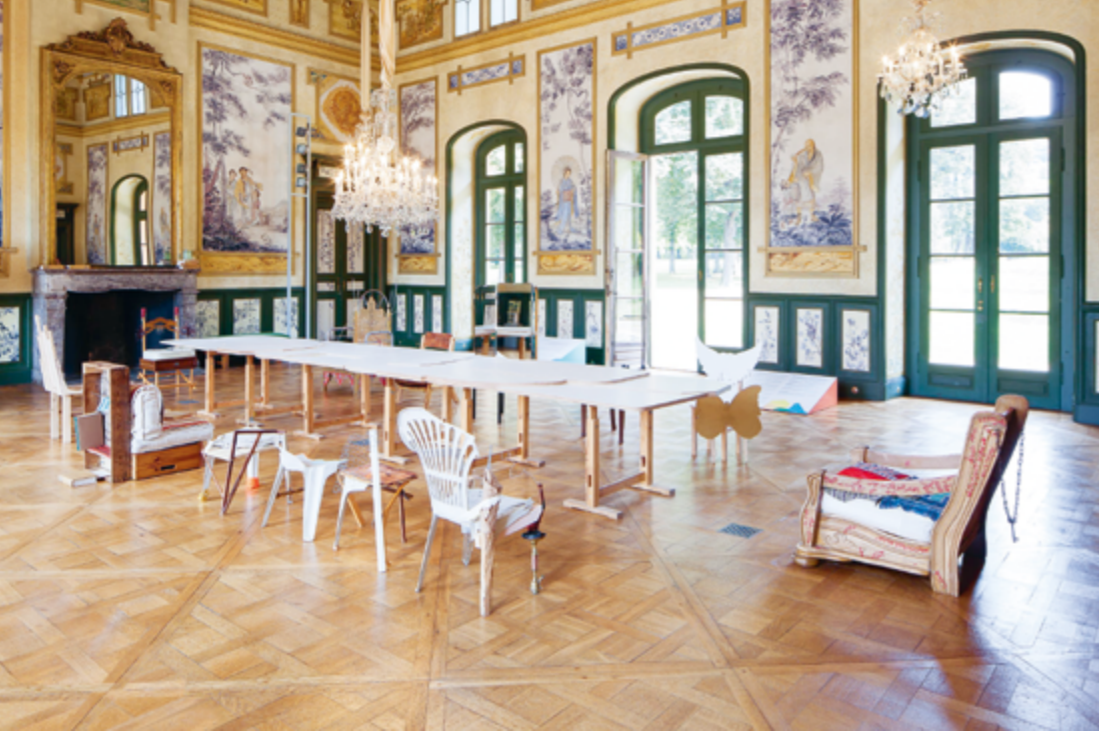
Hauptsaal im Bergpalais, Ausstellungsansicht „Creative Collision. Studio Rygalik und junge Kreative“ 2016