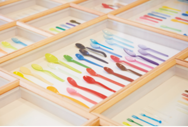
Ausstellungsdetail „Spoon Archaeology“, 2021