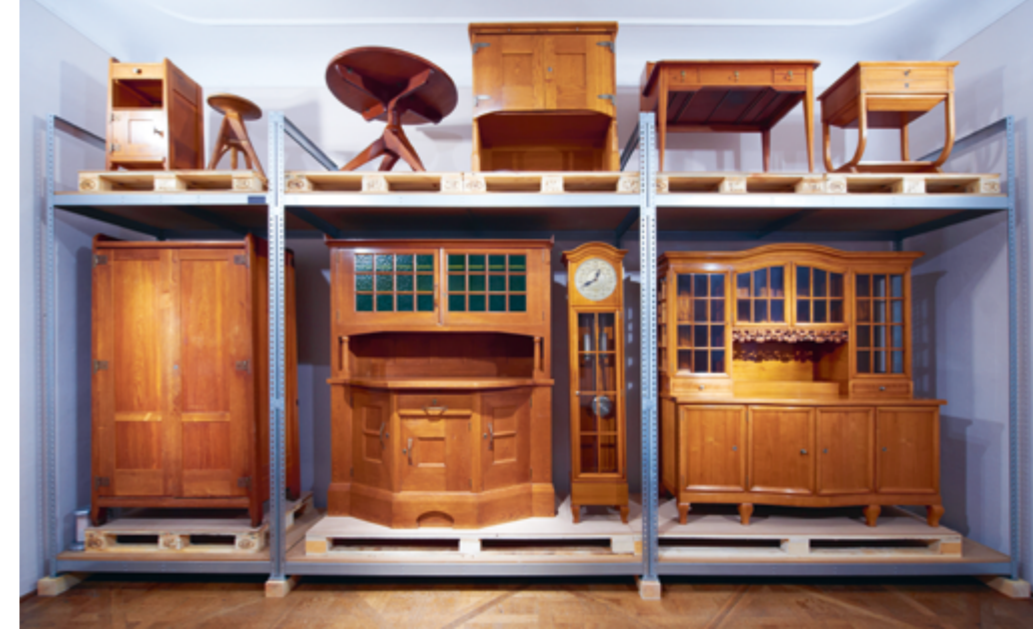
Schaudepot Deutsche Werkstätten