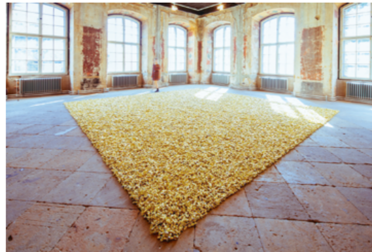
Felix Gonzalez-Torres, „Untitled“ (Placebo – Landscape – for Roni), Schenkung Sammlung Hoffmann