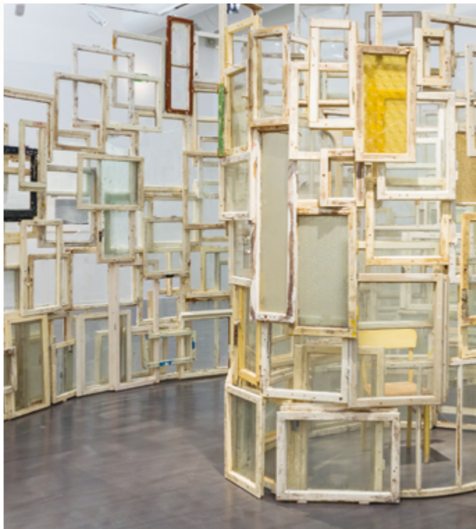
Chiharu Shiota „Inside-Outside“, Schenkung Sammlung Hoffmann © VG Bild-Kunst, Bonn 2022

Die Bestandteile für die große Installation „Inside-Outside“ sammelte Chiharu Shiota auf Baustellen im Osten Berlins. Die alten Fenster aus Holz wurden in den späten 1990er Jahren massenweise gegen Kunststoffrahmen ersetzt; ein Zeichen von Aufschwung und Modernisierung. Als Sinnbild durchlässiger Grenzen zwischen Innen- und Außenraum wirken sie wie Zeugen für das Leben, das sie umgaben. Dabei verwischt die offene, begehbare Installation die Zuordnung von Innen und Außen, von persönlichem und öffentlichem Raum, von Betrachtenden und Betrachtetem. Im barocken Hauptsaal des Wasserpalais korrespondiert das zeitgenössische Werk nicht nur mit der historischen architektonischen Anlage dieses Gebäudekomplexes, dessen Fensterfront den Blick auf die dahinter fließende Elbe freigibt und inszeniert. Es verweist zudem auf das Wechselspiel von Natur und Kultur als eines der gestalterischen Leitprinzipien der komplexen Parkanlage. Der Blickwechsel berührt darin ein Thema, auf das weitere Arbeiten aus der Schenkung Sammlung Hoffmann ab August im Rahmen der Ausstellungsreihe „Artists’ Conquest“ an verschiedenen Orten des Schloss und Park Pillnitz reagieren werden.